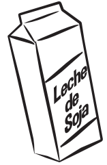
'Leche' de soja sin endulzar